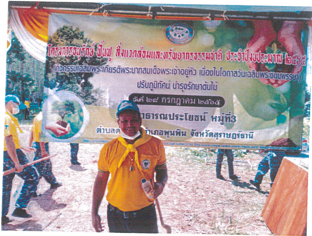
ภาพที่ ๒.๑ จัดเตรียมอุปกรณ์/สถานที่ในการจัดทำโครงการ