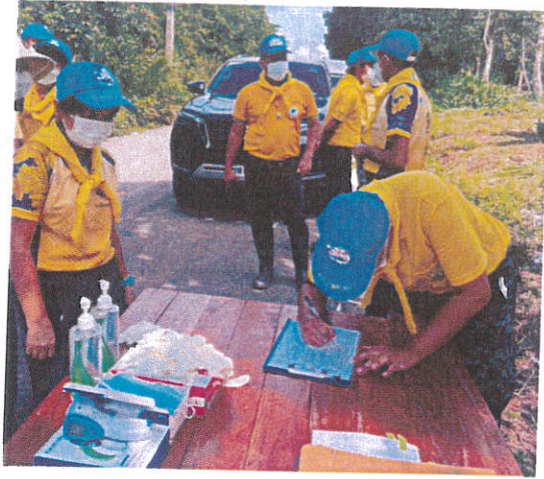
ภาพ ๒.๔ ขั้นตอนการดำเนินงานตามกิจกรรมโครงการ